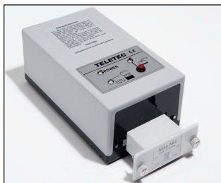
Tisch-Ladegerät LG-AK2 für 230 VAC oder 24 VDC zum Aufladen des Wechsel-Akkus AK2