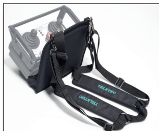
Trageplatte, Bauchgurt und Schulter-Trageriemen für Funksender FW53-S